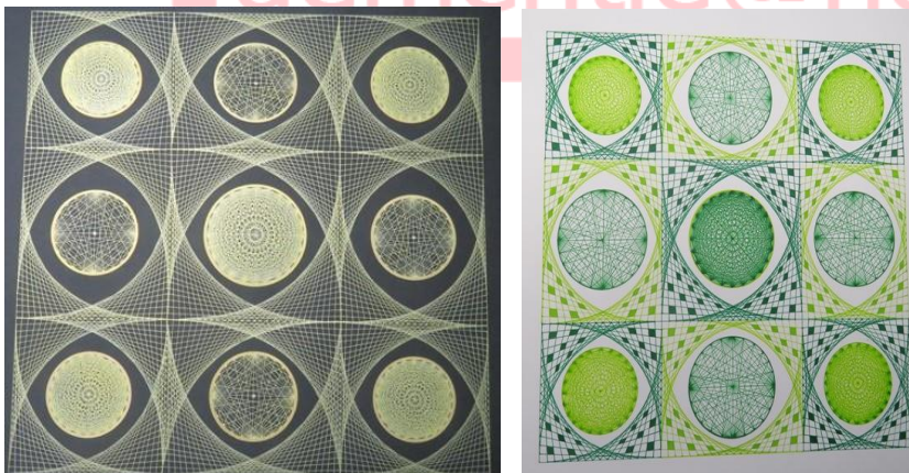
Twee keer dezelfde tekening en toch zo anders

Als ik aan het tekenen ga, weet ik dikwijls niet wat ik ga doen. Ik begin met een punt, een lijn, een cirkel. Maakt niet uit wat en dan laat ik het op me af komen. En terwijl ik aan het tekenen ben, krijg ik langzaam maar zeker vlinders in mijn hart. Een gevoel dat zegt : het is goed wat ik aan het doen ben. En dat gevoel blijft zolang ik aan de tekening bezig ben. Teken en kleuren zet me in het moment zelf. Ik vergeet alles om me heen. En ook al voel ik me moe en futloos : dit kost geen energie. Integendeel. Ik krijg er energie van. Ik draag deze tekening op aan alle mantelzorgers en aan iedereen die met en voor mensen met dementie werkt. Ik weet dat jullie dit doen met heel veel liefde en daar heb ik heel veel respect voor.